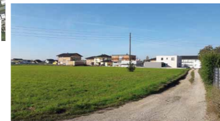
QR-Code scannen und auf Google Maps ansehen!