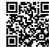
QR-Code scannen und auf Google Maps ansehen!