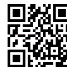
QR-Code scannen und auf Google Maps ansehen!